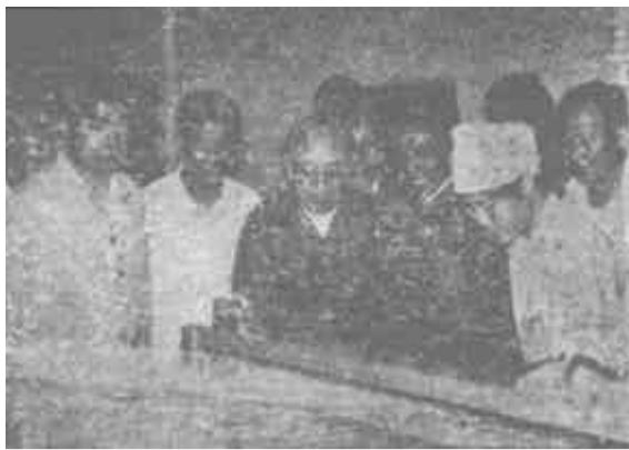
全国政协副主席钱伟长教授在我市视察期间,对市的资源开发及重点工程进行了深入的调查。图为钱教授在唐生海、李殿魁等领导同志陪同下参观棉纺厂。