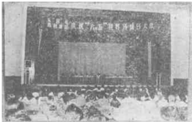
图为纪念“六·五”世界环境日会议会场。