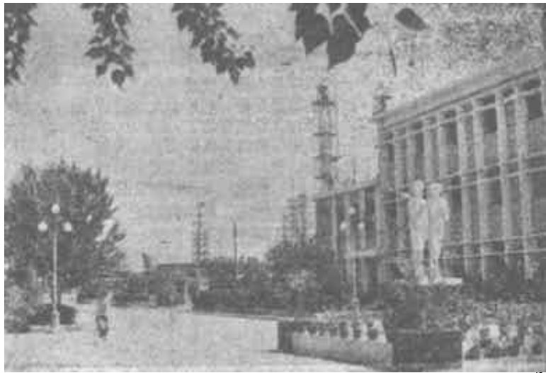
荣获全国环境优美工厂称号的石油大学胜华炼油厂一角